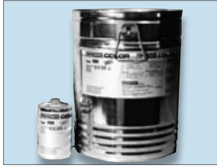
Abb.: "RM" Auswaschmittel Flammpunkt >100°C