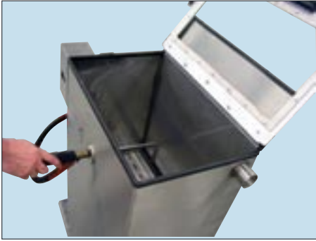
Abb.: Aufsicht mit drehbarem Sprühstab.